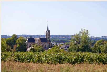
Église des Sœurs de la Providence

Au cœur de la Vallée du Loir, ce village est un trésor d'histoire, de charme rural et de beauté naturelle qui joue avec la lumière quelle que soit la saison ou l'heure de la journée.