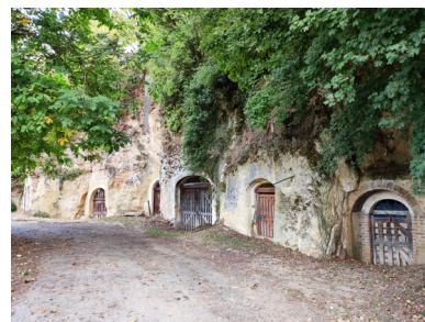
Caves de Dauvers