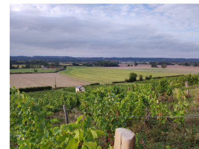
Coteaux du Jasnières