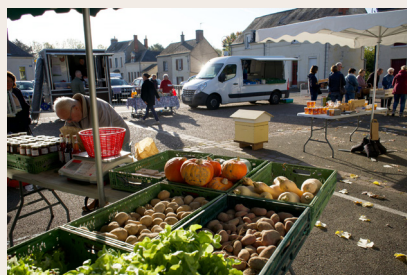
Jour de marché à Ruillé-sur-Loir

Ruillé-sur-Loir est bien plus qu'un simple village ; c'est une destination qui vous offre une immersion totale dans la beauté, l'histoire et la culture de la Vallée du Loir.