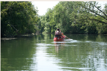
Au fil de l'eau sur le Loir

Franchissez le porche de la Communauté de la Providence, et laissez vous saisir par la sérénité du lieu, l'imposante architecture de la chapelle conventuelle, le charme de la toute première école de filles ou encore de la buanderie alimentée par la Tortaigne et l'exceptionnelle salle du bain voûtée.