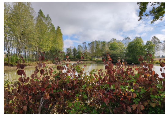
Plan d'eau de la Petite Providence