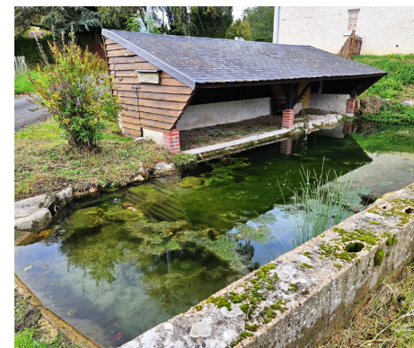
Lavoir de la Vallée de la Flotte