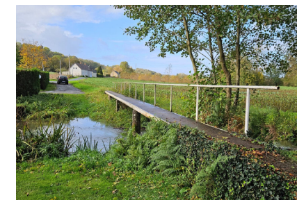
Le Tusson au Perray

• Comité départemental de la randonnée pédestre de la Sarthe : 02 52 19 21 35, sarthe@ffrandonnee.fr, www.sarthe.ffrandonnee.fr ou Facebook : FFRandonnée Sarthe.