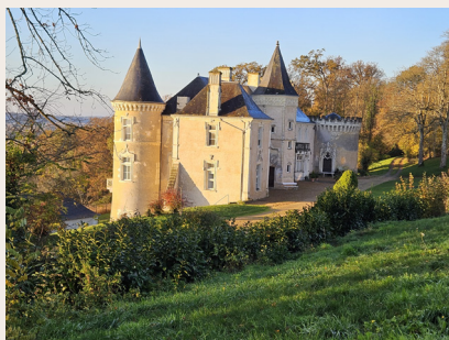
Le château de la Flotte

Loir-et-Cher et rejoindre le manoir de la Possonnière où vécut Ronsard.