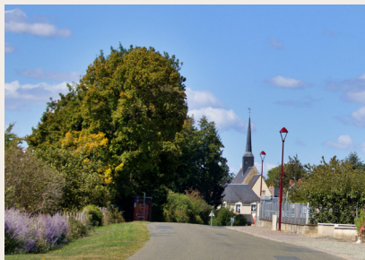
L'église Saint-Julien au centre du bourg

Le village est constitué de deux bourgs historiques, Lavenay avec son église et sa mairie et Pont-de-Braye avec sa gare. Il est situé entre les rivières du Tusson, de la Brayre et du Loir. Cœur historique de Lavenay. Le bourg est habité depuis l'époque gauloise.