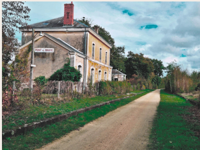
Le gare de Pont de Brayre

L'église Saint-Pierre Saint-Julien, érigée à partir du XIV e siècle, d'origine romane, décorée à l'intérieur de surprenants dessins du XVI e , est située au cœur du centre bourg historique.