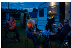
CIE MESEDEMOISELLES / © Laure VILLAIN