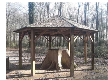
Le Chêne Boppe