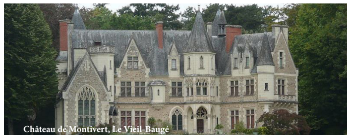
Château de Montivert, Le Vieil-Baugé