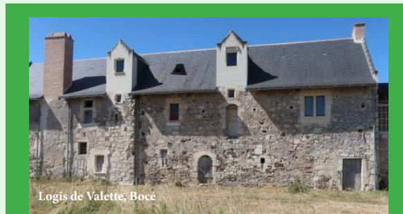
Logis de Valette, Bocé

Sam. et dim. 10h-12h et 14h-18h | gratuit