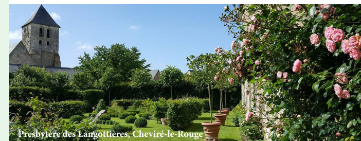
Presbytère des Langottières, Cheviré-le-Rouge

8, rue des Langottières - Cheviré le Rouge Sam. 14h-18h, dim. 11h-13h et 14h-18h | gratuit