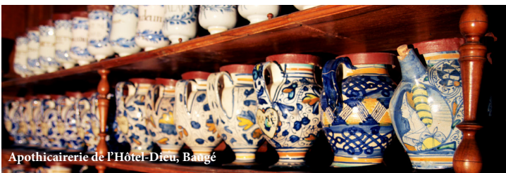
Apothicaire de l'Hôtel-Dieu, Baugé