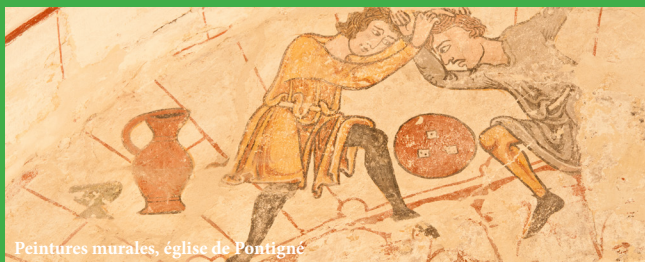
Peintures murales, église de Pontigné