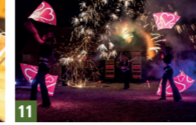
11. Compagnie Luminescence