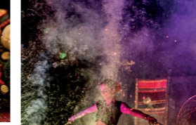
12. Compagnie Luminescence / 13. Ingrandes - Le Fresne