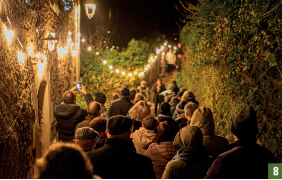
8. Saint Florent le Vieil