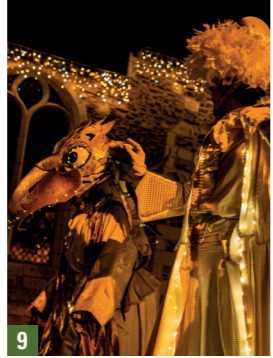
9. Denée / 10. Le Puy Notre Dame