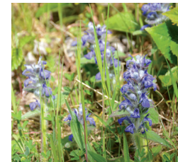
Bugle de Genève (mai à juillet)

Mais aussi : Lézard vert occidental , Lézard des murailles