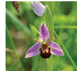
Ophrys abeille (avril à juillet)

Mais aussi : Orobanche pourpre , origan commun