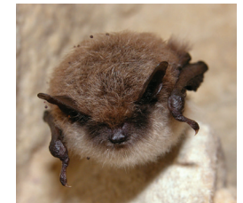
Murin à moustaches (nocturne)

Mais aussi : Ophrys araignée , Orchis pourpre