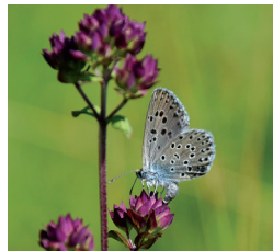
Azuré du serpolet (juin à juillet)

Mais aussi : Thécla du prunellier et Hespérie de la mauve