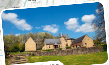
Manoir Pierre Fontaine