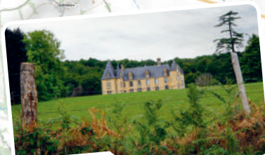
Château du Puy