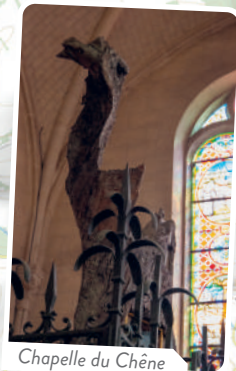
Chapelle du Chêne