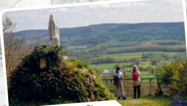
Notre-Dame des Champs