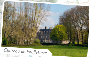
Château de Foulletorte