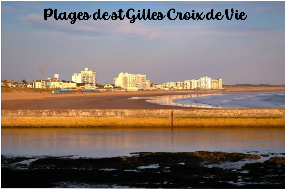
Plages de st Gilles Croix de Vie