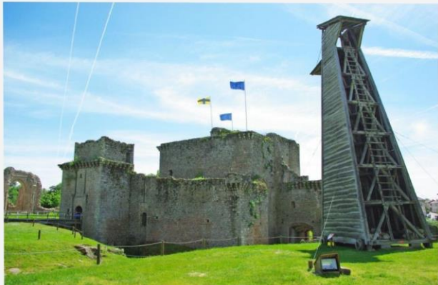
Château de Tiffauges

Les animations permettent de mieux comprendre la vie au Moyen Age, les stratégies de siège et les entraînements au combat. Elles sont très ludiques et appréciées des enfants. Les ruines de cette forteresse médiévale abritent le plus grand conservatoire des machines de guerre d'Europe et vous pourrez les voir en fonctionnement !