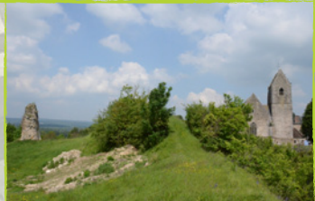
La motte féodale