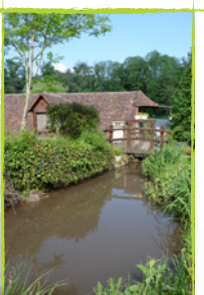
ST LONGIS Moulin Foussard