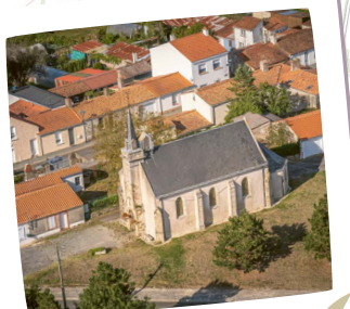
Chapelle de la Victoire