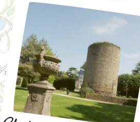
Château de la Garnache

0 250 500 750 Mètres Extrait de SCAN 25® - © IGN - 2020 - Autorisation n°40 - 20.12