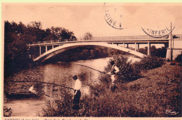
VERTOU (Loire-Inf.) — Pont de la Ramée sur la Sèvre

Le pont de la Ramée - Un premier pont payant, rendu gratuit en 1907, est ouvert en 1857 pour relier Nantes à Clisson. Long de 50m, fait de métal et de deux colonnes en fonte remplies de béton, il s'avère impropre au passage de poids lourds et devient vite vétuste. En 1938 et au même endroit, un nouveau pont accueille la circulation de véhicules, plus solide car construit en béton armé, plus large et démunie de colonne ce qui n'entrave pas la navigation de la Sèvre.