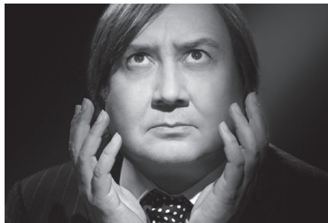
Michel Fau