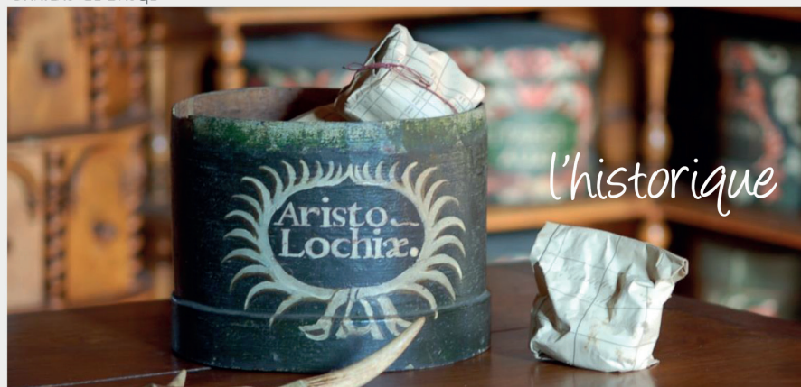
APOTHECAIRERIE DE BAUGÉ