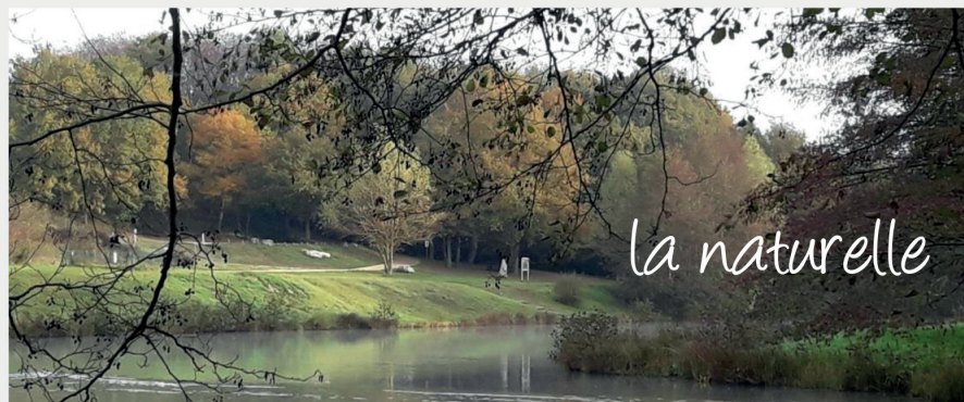
PLAN D'EAU DE BAUGÉ