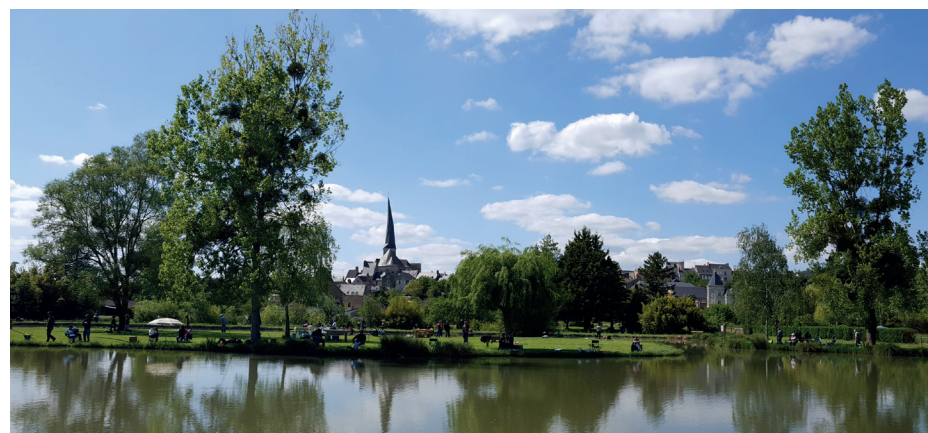
Vue sur le Vieil-Baugé depuis l'étang