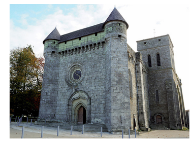
Église Saint-Pierre fortifiée

Comité • FFRandonnée Vendée : 02 51 44 27 38, ffrando85@orange.fr , http://vendee.ffrandonnee.fr .