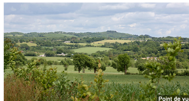
Point de vue

7 Traverser la départementale (prudence) et rejoindre en face le bourg du Boupère par le chemin le long du lotissement. Prendre la rue à droite, puis immédiatement à gauche la rue Maréchal Foch pour rejoindre le point de départ.