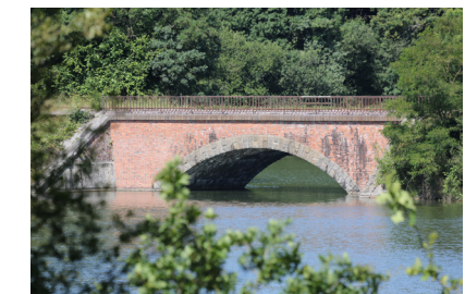
Pont de pierres