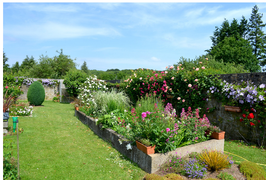
Le jardin des Carmes