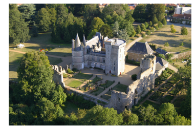
Château de la Flocellière

Comité • FFRandonnée Vendée : 02 51 44 27 38, ffrando85@orange.fr , http://vendee.ffrandonnee.fr .