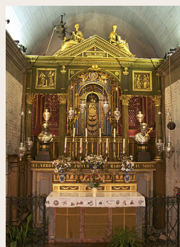
La Chapelle de Lorette

fond de la chapelle. La Sainte Maison est inscrite à l'inventaire supplémentaire des Monuments Historiques.