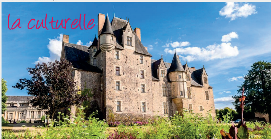
CHÂTEAU DE BAUGÉ