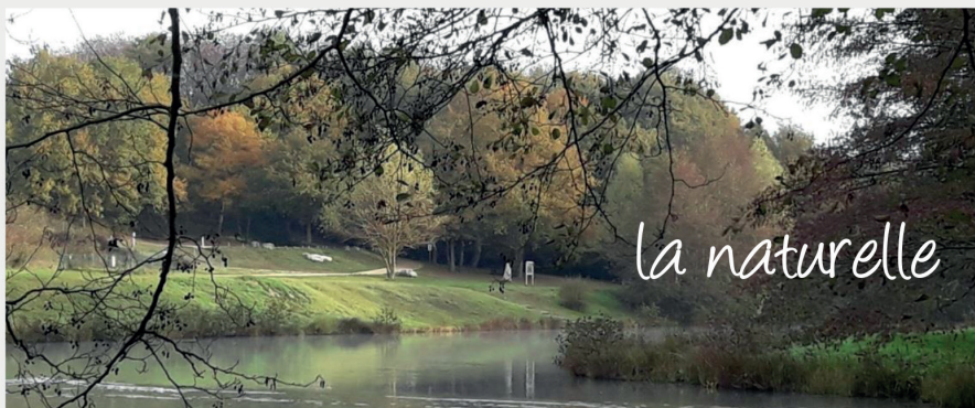
PLAN D'EAU DE BAUGÉ