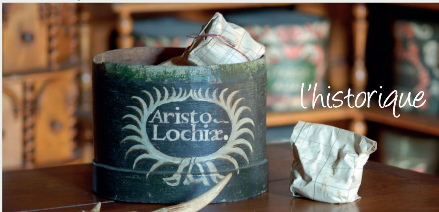
APOTHIKAIRIE DE BAUGÉ