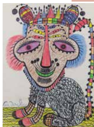
Germain VAN DER STEEN Le Chat

Cette section dévoile des personnages, issus des mythes, de contes populaires et d'histoires bibliques qui peuplent les productions marginales. Les religions sont un thème souvent exploité par les créateurs hors-normes qui y trouvent prétexte à créer des œuvres particulièrement fortes. À travers elles, ils cherchent à exprimer leurs croyances, à louer la beauté de la création, ou encore à envoyer un avertissement à leurs contemporains. Dans ces créations, la représentation de l'animal contribue également à créer un bestiaire fantastique, protagoniste privilégié des œuvres naïves et singulières.