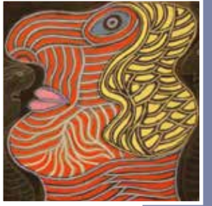
Pierre ALBASSER L'aristocrate

Résultant d'une inspiration libre, les œuvres des Naïfs et Singuliers dépeignent des mondes vertigineux caractérisés par une imagination débordante. En se laissant porter par leurs propres visions, les créateurs content leurs errances intérieures. Ces voyages sont ciselés par la répétition incessante et obsessionnelle d'un même motif ou d'une même idée. L'utilisation systématique d'un même support ou d'un format spécifique est également caractéristique des productions de cette section. L'image invasive inonde le support à l'instar des végétaux de Séraphine, des figures monstrueuses de Joël Lorand, du bestiaire de Pierre Albasser ou chez Henri Trouillard, de l'Ouroboros, ce serpent qui se mord la queue, symbole d'éternité. Ces auteurs créent loin des codes et canons esthétiques, dans une démarche d'accumulation, avec pour seule ambition celle de répondre à leurs propres pulsions créatrices qui les envahissent au quotidien.