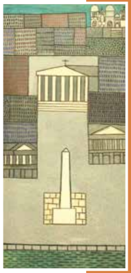
Véronique FILOZOF Place de la concorde

Les Naïfs et Singuliers étonnent par leur écriture plastique très personnelle. En maîtres autodidactes de la palette et de la technique, ils s'efforcent de calquer les règles de composition mais se trouvent très vite confrontés à leur manque de formation, obstacle qu'ils compensent en usant d'astuces et de solutions toutes personnelles. Ces créations ne peuvent pas être cataloguées dans un mouvement défini par des conventions établies. Chaque artiste opère au gré de ses propres règles : travail préparatoire, écriture automatique, geste spontané, jeux de perspectives et de profondeur. Dans cette salle, l'œil de l'observateur est guidé par l'usage de cadrages serrés, de formats insolites, de points de vue audacieux. Pour ces artistes, l'art de composer n'est pas appris en école et consiste à poser un regard libre sur le monde.