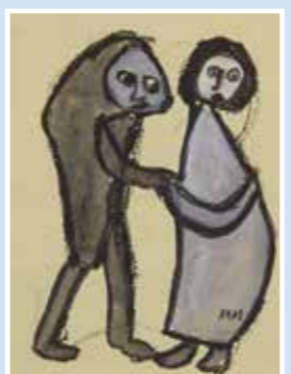
Adam NIDZGORSKI Sans titre

Les œuvres graphiques nécessitent des conditions de conservation spécifiques. Très fragiles, elles sont conservées dans un mobilier adapté, le cartonnier, qui les protège de la lumière, tout en leur permettant de rester en permanence accessible au public.