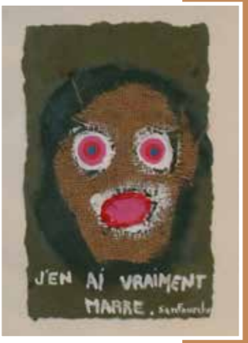
Jean-Joseph SANFOURCHE J'en ai vraiment marre

Véritables poètes contemporains, les artistes autodidactes explorent des modes d'expression pluriels : ils peignent, dessinent, sculptent, assemblent, triturent, inventent leurs propres matériaux et produisent des œuvres inclassables. Ils s'approprient des supports divers et expérimentent sans cesse de nouvelles manières de travailler les matières. Les créations ainsi constituées peuvent mêler assemblages hétéroclites, jeux de textures et matériaux détournés. En portant les traces du geste de l'artiste, les productions semblent être autant de témoignages de la recherche menée par les plasticiens. Entre leurs mains, la matière déchue et le support détérioré sont assemblés, réemployés et magnifiés afin de composer des œuvres qui bousculent les repères.