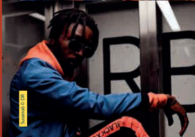
Susanoô