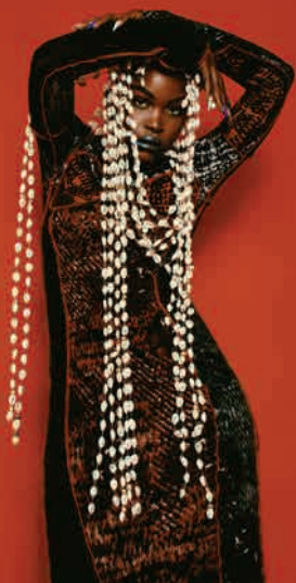
Pongo © Axel Joseph