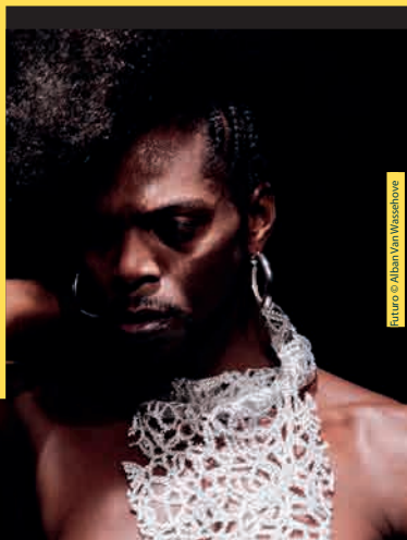
Portrait © Alban Van Riesenboer