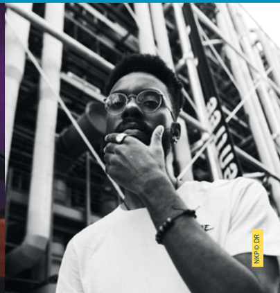
NKP © DR