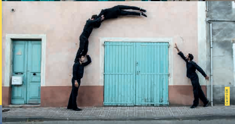
Cie XY & DR