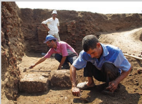
Illustration : Découverte de blocs pharaoniques au cœur de l'ancienne ville de Dibgou. 2017

Samedi 6 janvier Samedi 3 février Samedi 3 mars