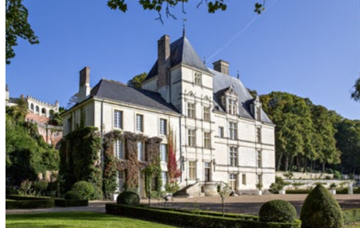
Couverture : La Chartre-sur-le-Loir

À Chahaignes, église Saint-Jean-Baptiste : accueil et présentation de l' EXPOSITION « Les plus belles photographies de l'Inventaire du patrimoine », de 14h à 18h.