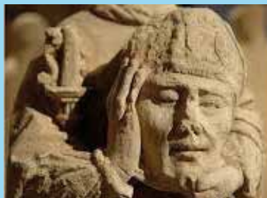
Détail de la statue de Saint-Denis.