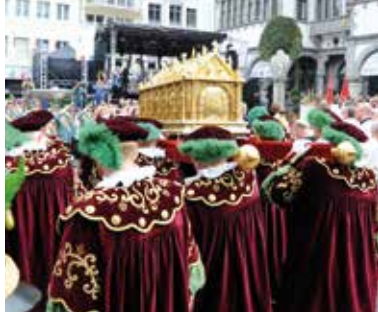
Procession des reliques de Saint-Liboire en 2017 au Mans.