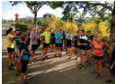
Running visite.