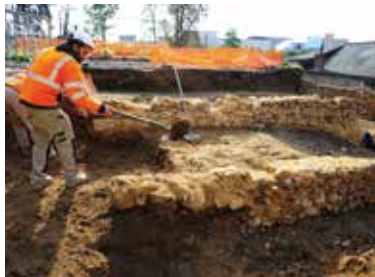
Fouille des jardins de la cathédrale.