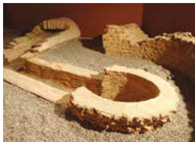
Les thermes romains.