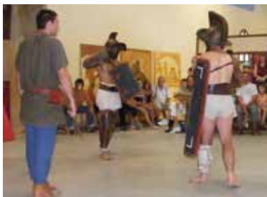
Démonstration de gladiateurs (© sarl Acta).