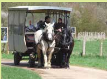
Carriole de la ferme de la prairie.