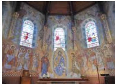
Fresques de N. Greschny.