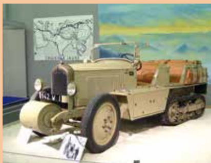
Autochenille Kégresse de Citroën (1931) qui a participé à la croisière jaune.

Musée des 24 Heures du Mans : 02 43 72 72 24