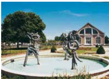
Vue sur la Maison de l'Eau.