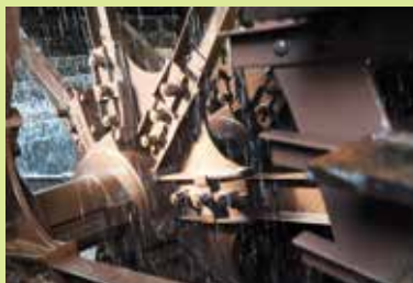
Roue hydraulique à aubes à la Maison de l'eau.