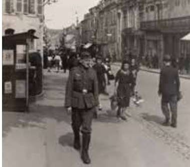
Le Mans sous l'Occupation.