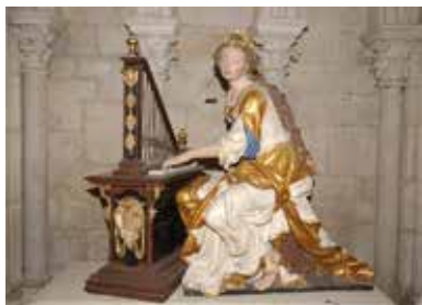
Terre cuite de Sainte-Cécile.