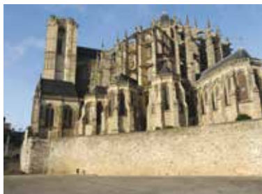
La cathédrale Saint-Julien.