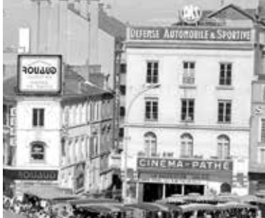
L'ancien cinema Pathé, place de la République.