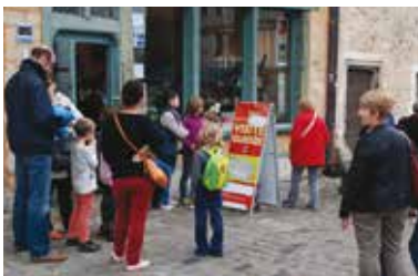
Visites guidées au départ de la Maison du Pilier-Rouge.