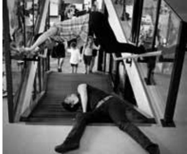
ZB- Impromptu chorégraphique (© CSZ Photographie).