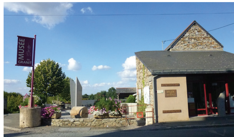
Musée du Granit (Bécon-les-Granits)