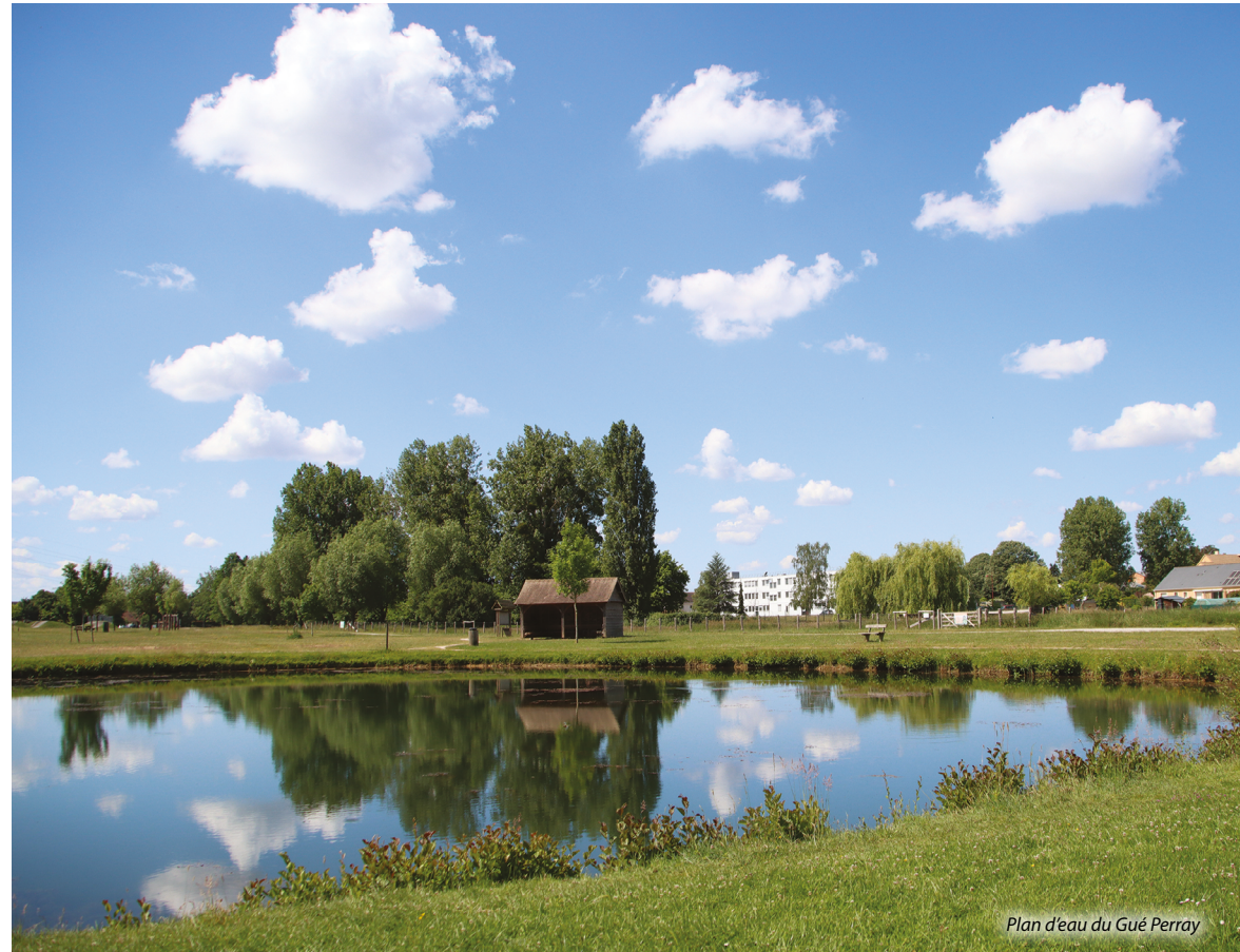
Plan d'eau du Gué Perray

Continuez pendant 600 mètres, puis au carrefour de chemins, tournez à gauche sur le chemin aux Bœufs qui est bitumé. ❺ Continuez tout droit,