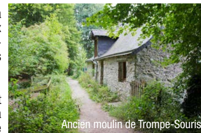
Ancien moulin de Trompe-Souris

Etape 4-1 Empruntez le chemin à gauche et traversez le verger conservatoire jusqu'à la D 32, puis rejoignez la mairie.