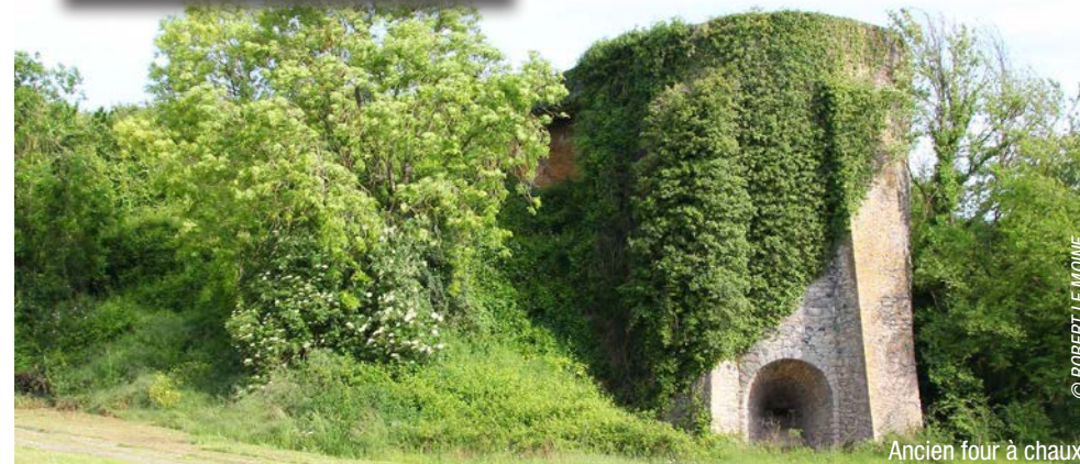
Ancien four à chaux