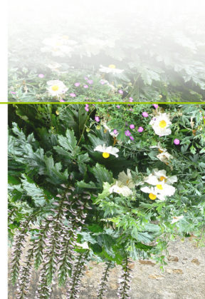
Le circuit des jardins