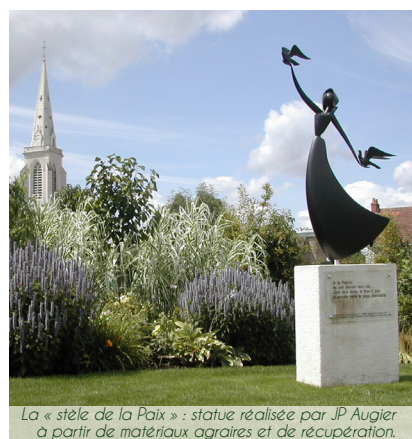
La « stèle de la Paix » : statue réalisée par JP Augier à partir de matériaux agraires et de récupération.

femme qui lance vers le ciel les colombes de la Paix... d'où la dénomination de ce site.