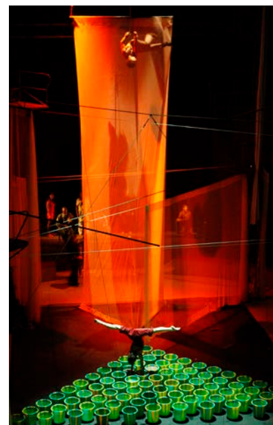
Artiste équilibriste dans une oeuvre de Daniel Buren

Manifestation organisée en partenariat avec la ville du Mans