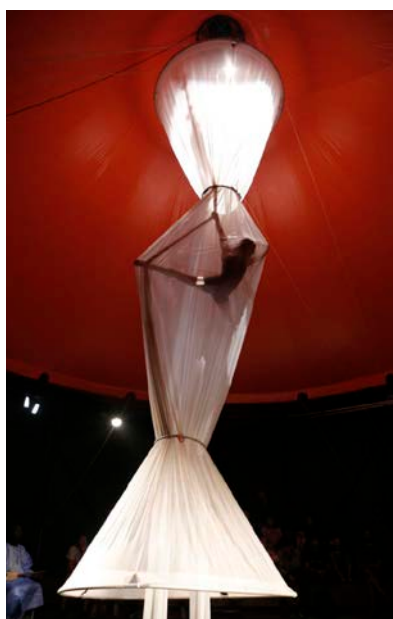
Artiste aérienne dans une oeuvre de Daniel Buren