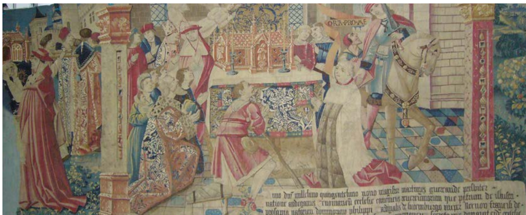
Tapisserie flamande de Saint-Gervais et Saint-Protais (XVI e siècle)