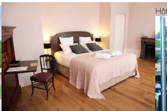
Le Gentleman