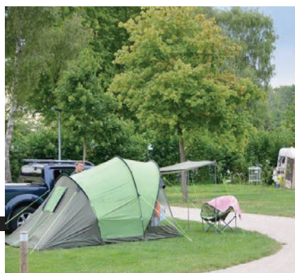
Camping de La Flèche

La chambre d'hôtes, Le Moulin Page , proche de Château-du-Loir, connaît une fréquentation stable par rapport à 2014. Ils notent une hausse de la clientèle étrangère par rapport à la clientèle française, pourtant majoritairement présente les années précédentes. Les séjours sont plus longs (jusqu'à 5 jours en chambre d'hôtes) que de simples haltes, et les propriétaires s'adaptent aussi au phénomène de réservation de dernière minute.