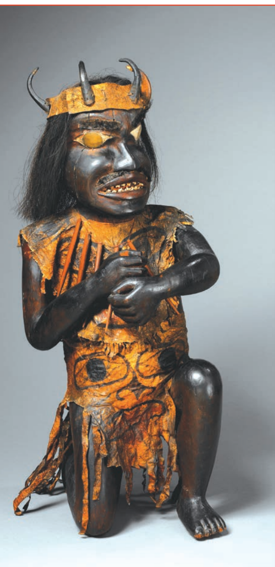
Statue de chaman

© musée du quai Branly - Jacques Chirac, photo Patrick Gries Inv. 71.1951.35.2