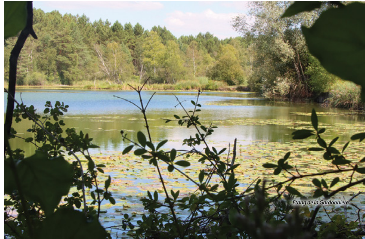
Étang de la Gardonnière

Si vous souhaitez faire la randonnée entière, tournez à gauche après le Gué de l'Aune pour suivre le chemin en terre qui mène vers les étangs de la Gardonnière. 3 Après le passage à gué, où votre cheval pourra s'abreuver, 4 continuez jusqu'au carrefour de la Maigretière où vous traversez la route. Après avoir passé le Pignon Vert, vous apercevrez sur votre gauche le Moulin du Frêne où vous prenez à droite vers 5 la Ruelle aux loups. Après 1,5 km, quittez le balisage violet pour tourner à gauche et continuez tout droit jusqu'à la route bitumée où vous prenez le chemin de terre qui se trouve en face, puis le chemin des Tremblays à droite (petit panneau indiquant le lieu-dit), après la maison qui fait l'angle. Traversez la route des Bouveries, rejoignez le chemin en herbe qui se trouve en face et au bout du