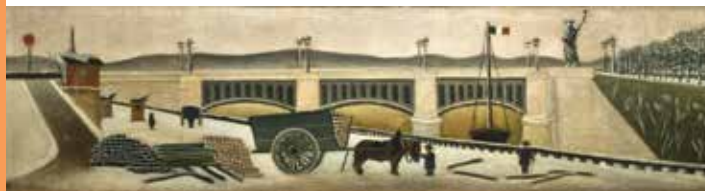
HENRI ROUSSEAU, Vue du Pont de Grenelle, vers 1882

Wilhelm Uhde, coleccionista y crítico de origen alemán, desempeñó un relevante protagonismo en la historia del arte naíf: primer biógrafo del Aduanero Rousseau, descubrió a Séraphine, Bauchant, Bombois y Vivin, les alentó en su trabajo y ayudó a obtener el reconocimiento que su obra se merecía. Rechazando atribuirles la denominación de «naífs», que encontraba reductora, les llamó los «primitivos modernos».