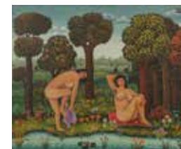
JOSIP GENERALIC, Les Baigneuses, 1967

El arte naíf halló en Europa del Este un territorio fértil, y se desarrolló muy rápidamente en la década de 1930, con un éxito internacional. Tres artistas, Ivan Generalic, Franjo Mraz y Mirco Virius, fueron los pioneros de este auge: en la década de 1930, fundaron la Escuela de Hlebine, escuela de pintura naíf que permitió a las diferentes generaciones de artistas croatas trabajar juntos.