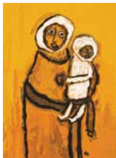
ADAM NIDZGORSKI, Sans titre 20e siècle