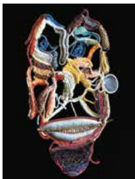
MARIE-ROSE LORTET, Chasseur de sons 20e siècle

Poco a poco, las creaciones singulares hallan su espacio en el mundo del arte. A partir de 1973, el Museo de Laval se amplía con obras procedentes de las artes marginales. Luego llegan La Fabuloserie de Alain Bourbonnais (1983), el área de la Création Franche en Bègles (1989), la colección Cerès Franco en Lagrasse (1994), y el Museo de Arte Moderno, de Arte Contemporáneo y de Art Brut de Lille Métropole con la donación de Aracine en 1995, entre otros, que procurarán superar los retos de conservación, de valorización y de transmisión de las obras procedentes de las artes singulares.