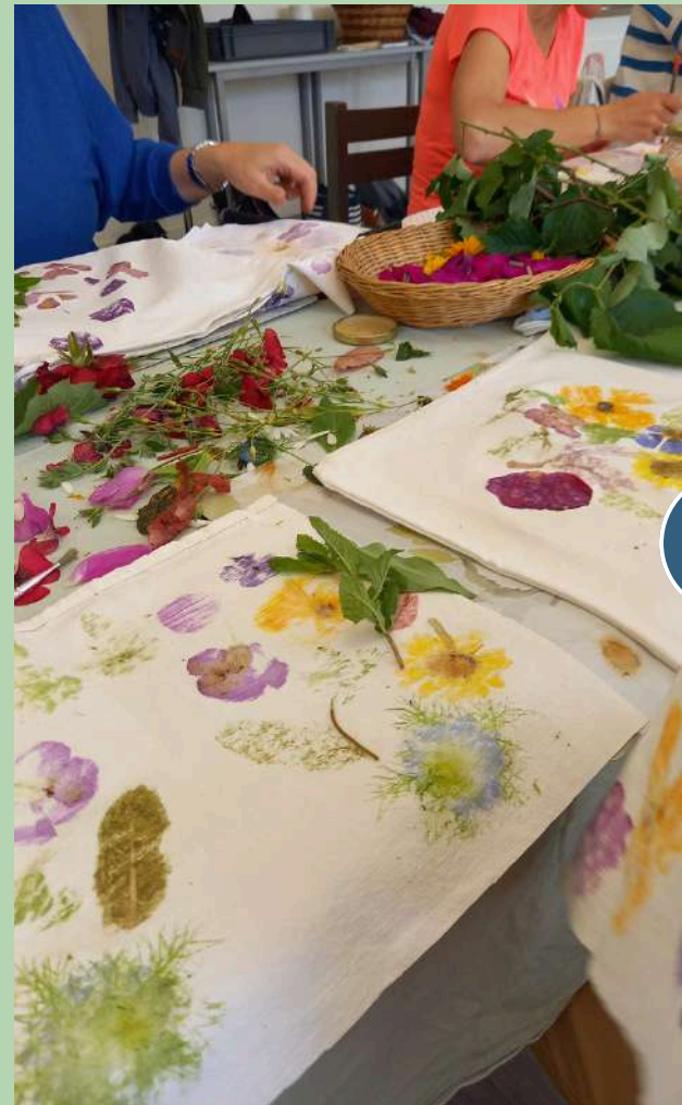
› Impression végétale

Mélange de tissus et de couleurs avec l’art ancestral des feuilles frappées ou tataki zomé. Chaque végétal et ses pigments, nous racontent ses histoires colorées pour un moment créatif. Essayer puis créer, chacun à sa manière.