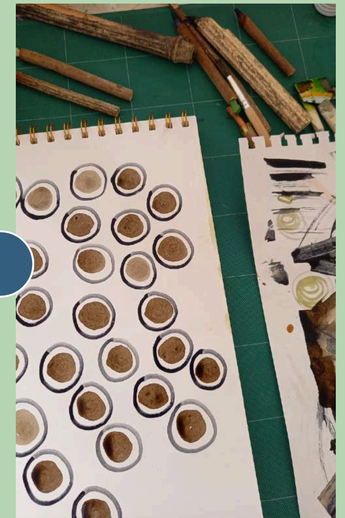
› avec les ressources locales

Durée : 2h - Jauge : 15 personnes max - Tarif : à la demande