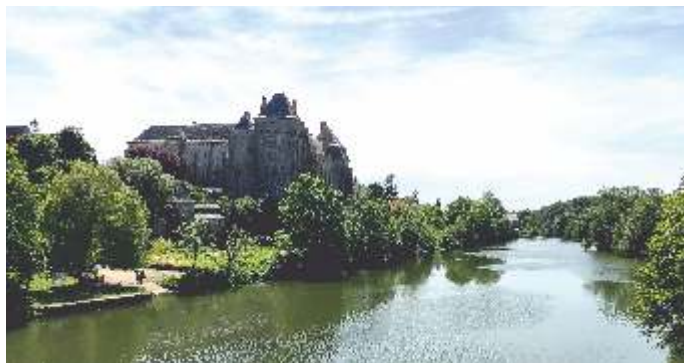
Abbaye de Solesmes