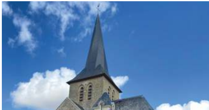
Clocher tors de l'église Saint-Jacques à Chemiré / Sarthe