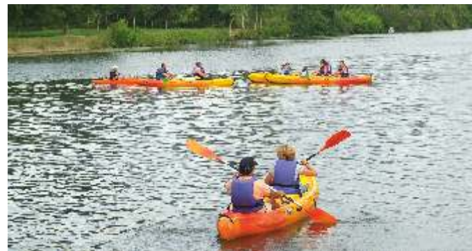
Activités de loisirs sur la Sarthe