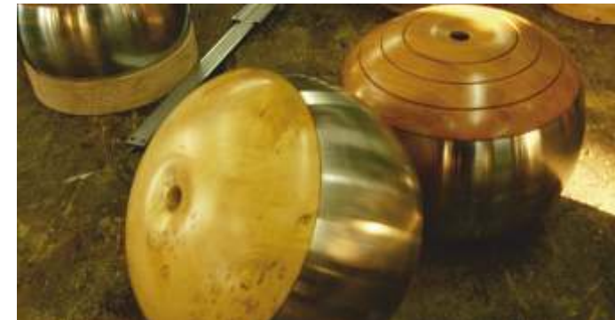
Atelier de fabrication de boules de fort de Morannes