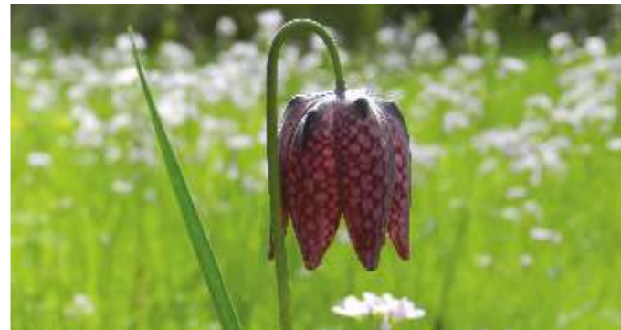
Espace Naturel Sensible des Basses Vallées Angevines