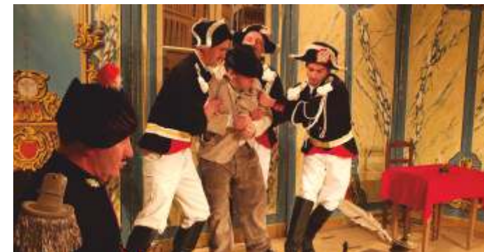
Théâtre Rouget le braconnier à Daumeray