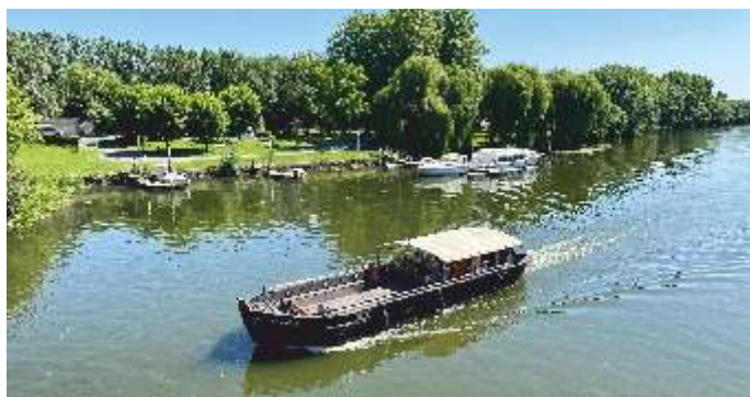
Croisière sur la Sarthe à bord de LA GOGANE