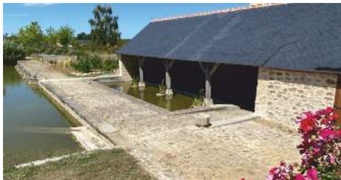
Lavoir de Daumeray