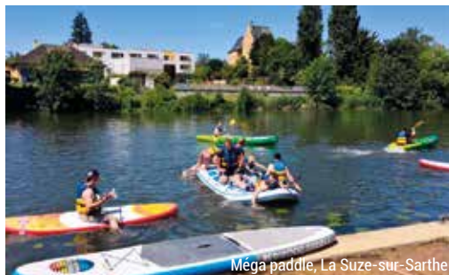
Méga paddle, La Suze-sur-Sarthe

Et si vous marchiez (ou presque) sur l'eau ? Choisissez un paddle en solo pour observer la rivière sous un nouvel angle. Si vous êtes adepte de bonnes parties de rire, à vous le paddle géant de La Suze-sur-Sarthe, c'est l'embarcation ludique par excellence. Entre 8 et 10 personnes peuvent s'y tenir debout !