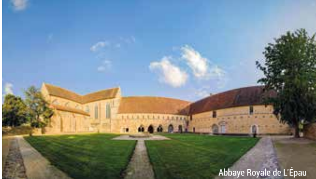
Abbaye Royale de L'Épau