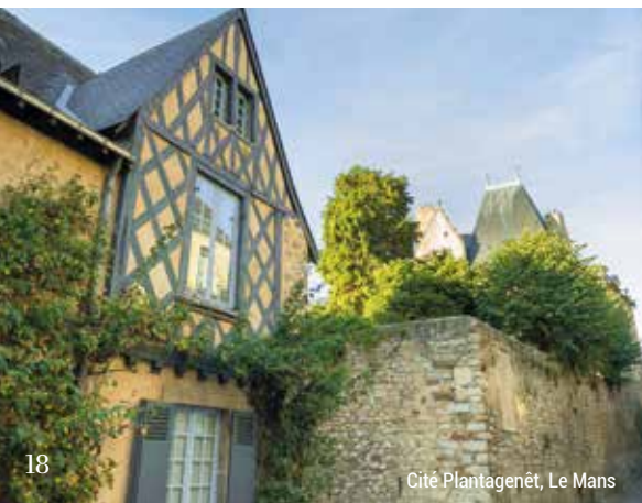
Cité Plantagenêt, Le Mans