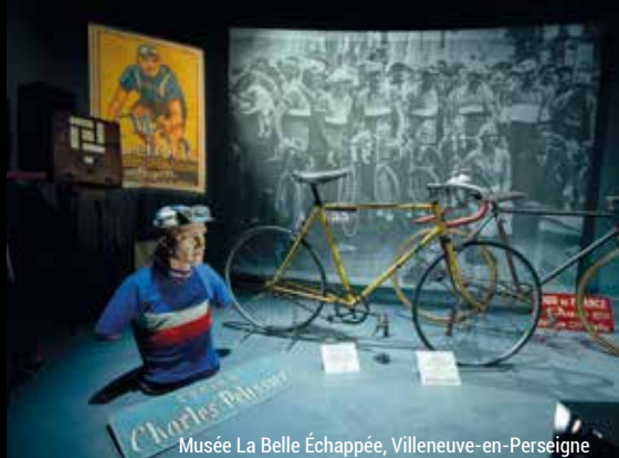
Musée La Belle Échappée, Villeneuve-en-Perseigne

Retrouvez l'ensemble des musées sur : www.sarthe tourisme.com/culture