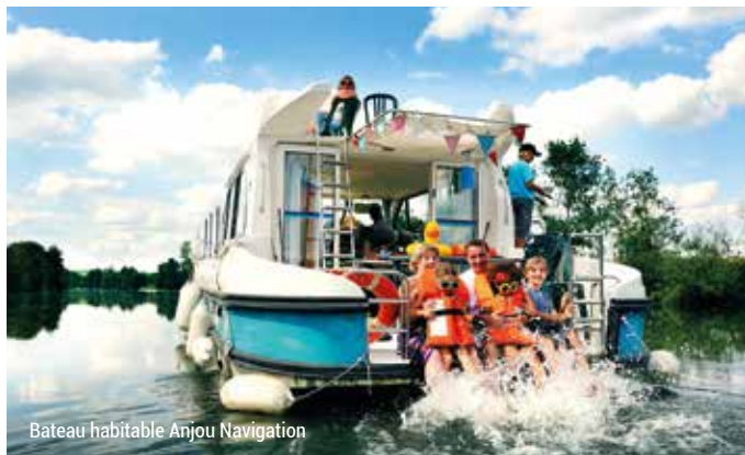
Bateau habitable Anjou Navigation