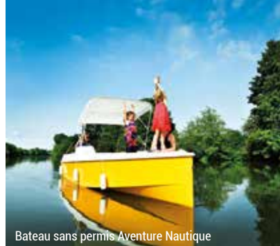
Bateau sans permis Aventure Nautique