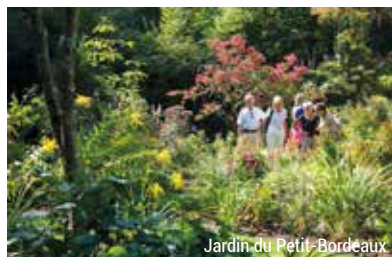
Jardin du Petit-Bordeaux

Flânez dans les sept jardins remarquables de la Sarthe et vivez une parenthèse bucolique et poétique : le prieuré de Vauboïn (1 er prix de l'Art du Jardin 2020), les jardins du donjon de Ballon, le jardin du Petit-Bordeaux, le jardin du château du Lude, le jardin du château de Villaines, le jardin du château du Mirail et le jardin Renaissance de Poncé-sur-le-Loir.