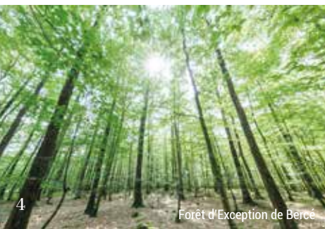
Forêt d'Exception de Bercé

Dans le département, 17 sites sont classés « Espaces Naturels Sensibles » et 12 sites Natura 2000. De nombreuses animations sont proposées toute l'année pour découvrir la faune et la flore dans le respect de la nature. www.sarthetourisme.com/la-sarthe-si-proche-si-nature