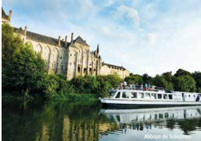
Abbaye de Solesmes