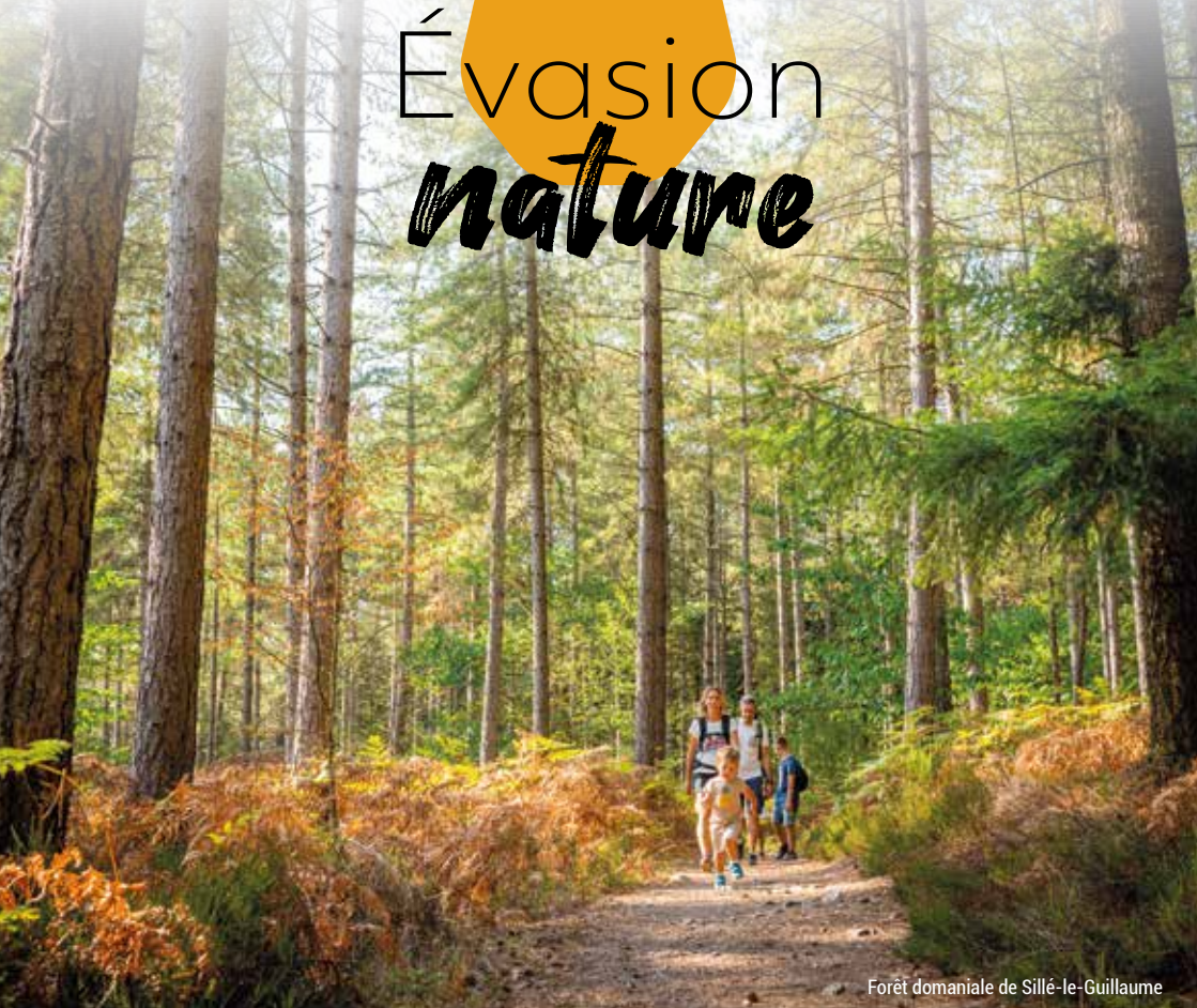
Forêt domaniale de Sillé-le-Guillaume

Forêts, bocages, rivières et petites montagnes façonnent le paysage sarthois. Cette diversité est une promesse d'évasion et de dépaysement faite à tous les passionnés de nature.