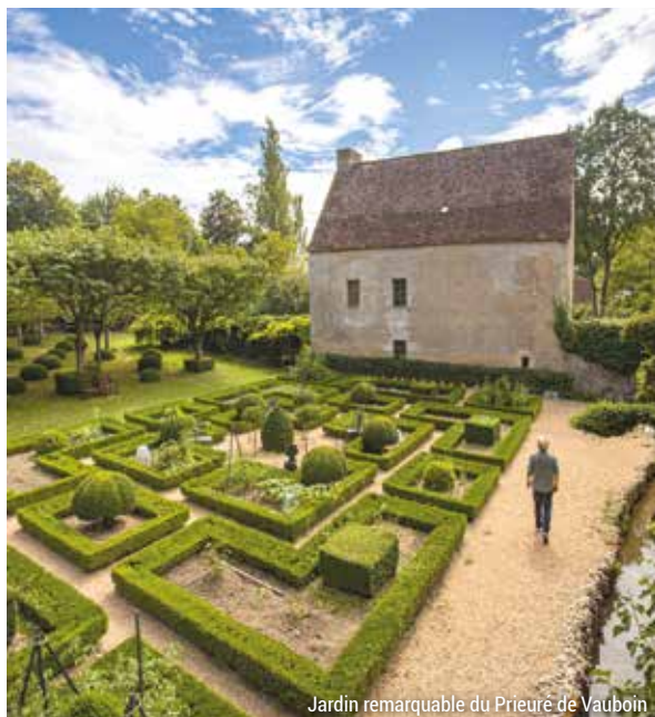
Jardin remarquable du Prieuré de Vauboïn

Retrouvez l'ensemble des jardins sur : www.sarthetourisme.com/voyage-poetique-au-coeur-des-jardins