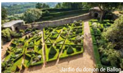
Jardin du donjon de Ballon