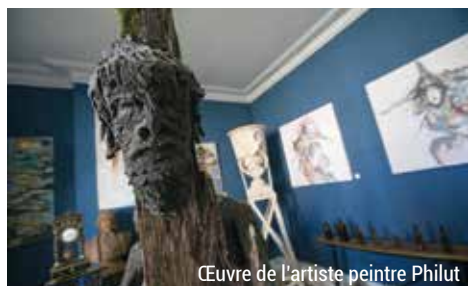
Œuvre de l'artiste peintre Philut

www.abap72blog.wordpress.com/les-boutiques-du-village