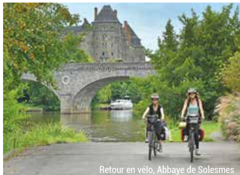
Retour en vélo, Abbaye de Solesmes