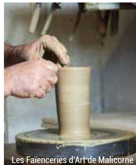
Les Faïenceries d'Art de Malicorne

Capitale historique de la faïence ajourée, la ville de Malicorne-sur-Sarthe accueille aujourd'hui des artisans au savoir-faire unique, qui utilisent une terre locale particulière, la terre de Ligron. Le musée de la Faïence et de la Céramique retrace l'histoire de cet art et présente de nombreux objets du quotidien ou de décoration à travers une muséographie ludique pour tous les âges.