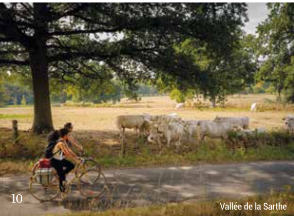
Vallée de la Sarthe