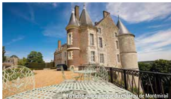
Terrasse panoramique du château de Montmirail