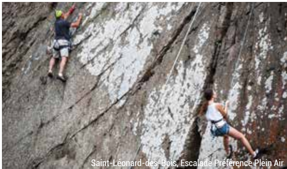
Saint-Léonard-des-Bois, Escalade Préférence Plein Air

Les sites du Saut du Cerf et de Rochebrune offrent un point de vue culminant et un panorama exceptionnel sur la forêt domaniale et le bocage de Sillé-le-Guillaume. Deux autres sites d'escalade sont à découvrir au Domaine du Gasseau à Saint-Léonard-des-Bois et à Louzes.