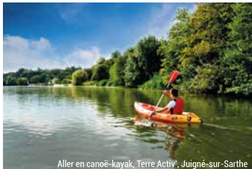
Aller en canoë-kayak, Terre Activ', Juigné-sur-Sarthe