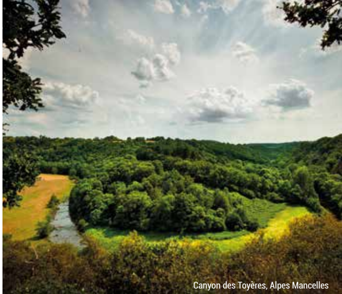
Canyon des Toyères, Alpes Mancelles

Le Parc Naturel Régional Normandie-Maine, dont font partie les Alpes Mancelles, est candidat au label Géoparc mondial UNESCO avec comme points forts ses pierriers exceptionnels.