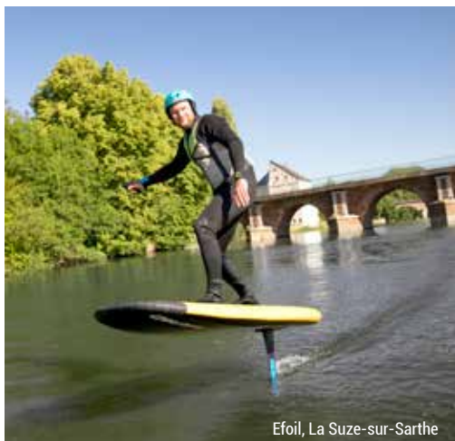
Efoil, La Suze-sur-Sarthe