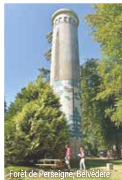
Forêt de Perseigne, Belvédère