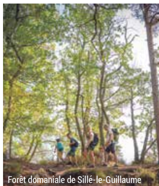
Forêt domaniale de Sillé-le-Guillaume

www.sarhetourisme.com/itineraires-pedestres