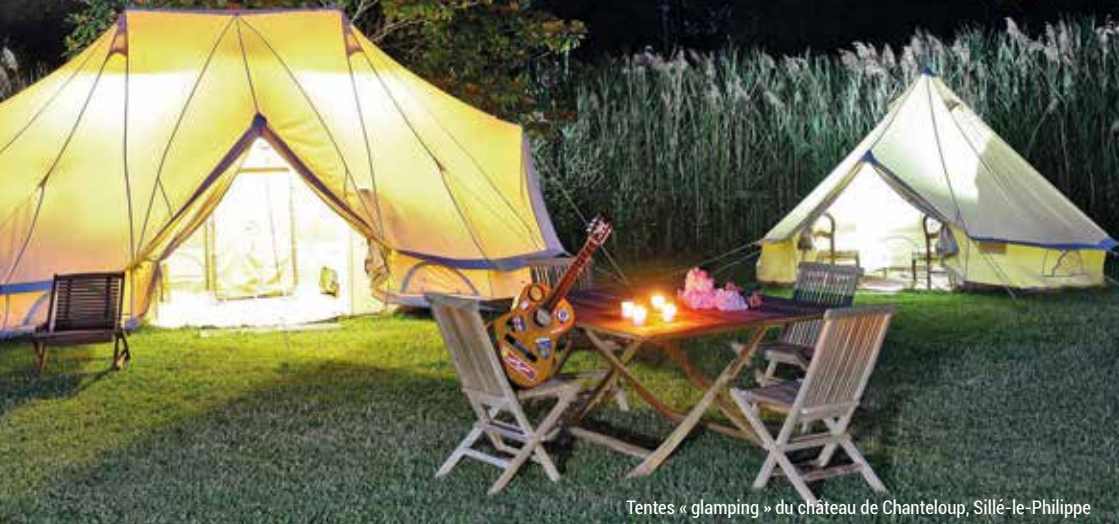
Tentes « glamping » du château de Chanteloup, Sillé-le-Philippe

Envie de dépaysement ? Découvrez quelques idées de séjours insolites proches de chez vous !