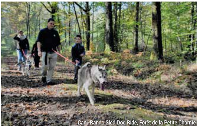
Canis-Rando Sled Dog Ride, Forêt de la Petite Charnie

www.sleddogride.fr www.lescrocsblancssarthis.fr