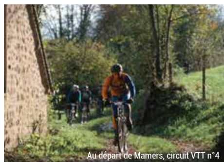
Au départ de Mamers, circuit VTT n°4