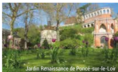
Jardin Renaissance de Poncé-sur-le-Loir