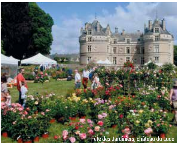
Fête des Jardiniers, château du Lude