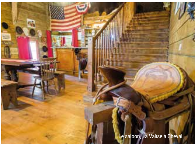
Le saloon, La Valise à Cheval